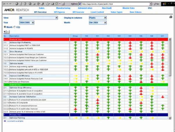
Balanced Scorecard im Controlling