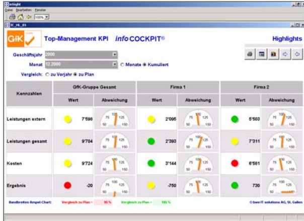
Kennzahlen-Dashboard für das Top-Management